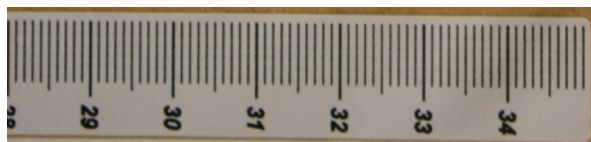
Figura 1: Régua utilizada no experimento

(1.e) De início, veja que o valor usado na incerteza das medidas de distância é de 0,1\text{ cm} . Perceba que as medições de comprimento são feitas por uma régua milimetrada (vide figura abaixo, retirada do anexo experimental A da prova), cuja precisão (menor medida) - como o nome sugere - é de 0,1\text{ cm} , o que logicamente sugere que esse (a precisão da régua) foi o critério adotado para determinar-se a incerteza.